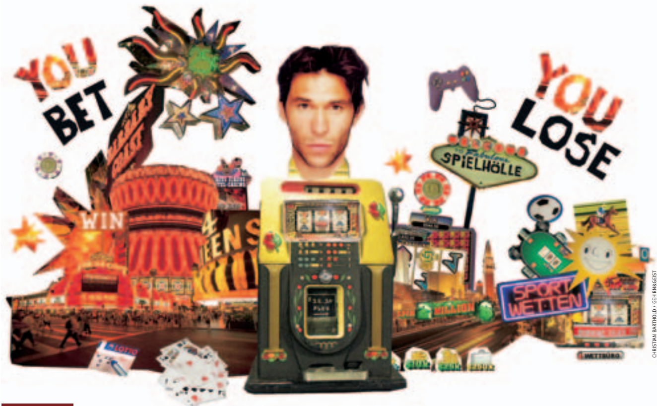
CHRISTIAN BARTHOLD / GEHIRN&GEIST